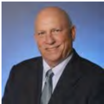
Antonio Puente, Presidente del Congreso

¡Con mucho entusiasmo les esperamos en el Cuadragésimo Congreso Interamericano de Psicología!